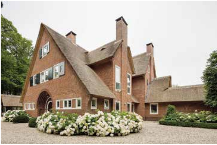
Voorgevel van het huis De Bijenschans in Hilversum.