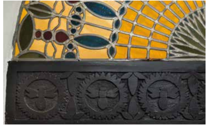
Glas-in-loodraam en snijwerk met bijenmotief in huis De Bijenschans in Hilversum.