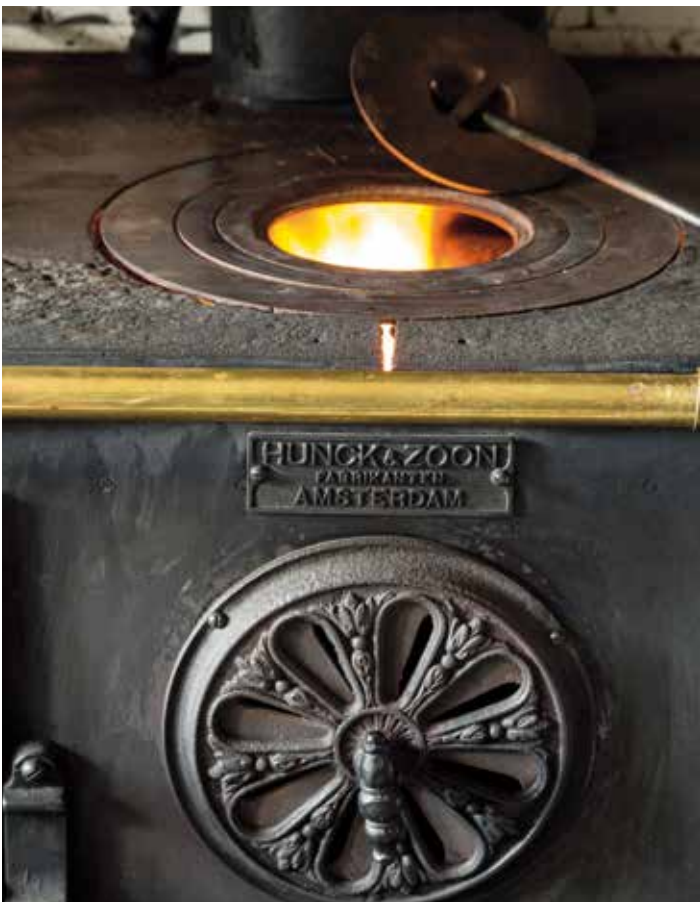
Kolenfornuis in de keuken van huis Van de Weg in Blaricum.