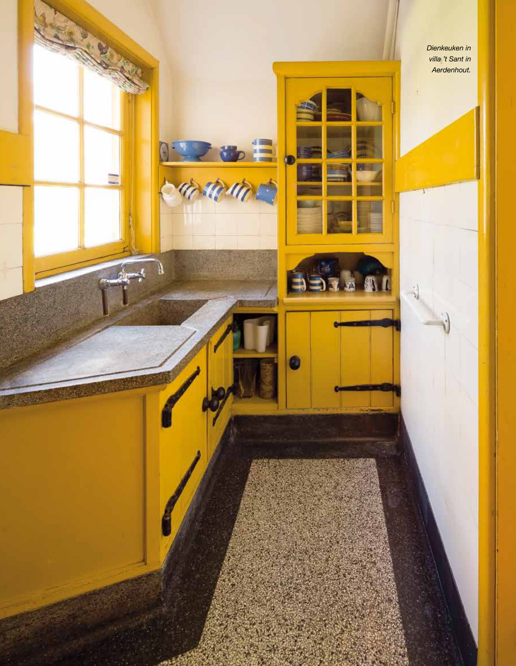
Dienkeuken in villa 't Sant in Aerdenhout.