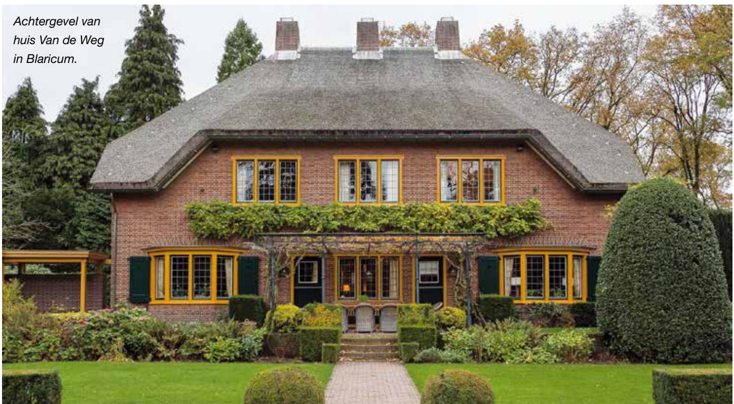
Achteregevel van huis Van de Weg in Blaricum.

Als mensen het verleden op deze manier levend houden verandert de omgang met het huis in een levensstijl. De 'best practices' van bewoners laten zien dat modern en oud prima met elkaar samengaan. Dit hoeft niet te betekenen dat alles gereconstrueerd en in dezelfde stijl moet zijn, of dat iedereen met oude meubels hoeft te leven. Maar liefde en respect voor het historische interieur is wel een voorwaarde voor behoud van de kwaliteiten die het huis bijzonder maken: de schoonheid, de zeldzaamheid, de betekenis als cultuurgoed. Zonder bewoners met hart voor het huis is het historische interieur kwetsbaar, ja zelfs volkomen weerloos. ■